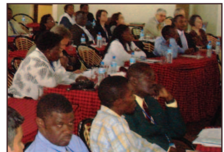
Les participants à la réunion de l'Observatoire des effectifs sanitaires africains en Tanzanie

Il est important de constater que les diplômés se sont sentis responsabilisés par leur capacité à susciter le changement. Par le biais du PVDL, « je sais comment aborder les personnes réticentes au changement et cela a eu un impact positif sur mes qualités relationnelles, » indique un participant. « J'ai davantage confiance en moi. » Et un autre d'ajouter : « Le PVDL m'a fait comprendre que moi aussi je pouvais être un leader. »