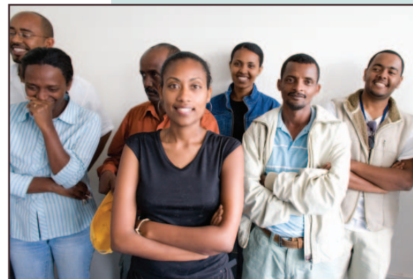
Le personnel d'IntraHealth en Ethiopie, une des organisations ayant pris part au PVDL

« J'évolue à présent au sein d'une équipe dynamique façonnée de la meilleure des manières par le PVDL. »