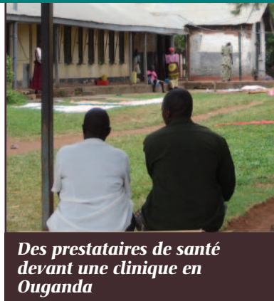
Des prestataires de santé devant une clinique en Ouganda

The Capacity Project IntraHealth International, Inc. 6340 Quadrangle Drive Suite 200 Chapel Hill, NC 27517 Tel. (919) 313-9100 Fax (919) 313-9108 info@capacityproject.org www.capacityproject.org