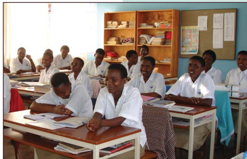
Les étudiantes profitent d'une salle de classe récemment remise à neuf à l'Ecole des infirmières et des sages-femmes de Rwamagana.

« La lutte contre le VIH, la planification familiale, la santé maternelle et infantile et les questions d'égalité hommes-femmes sont intégrées aux cours »