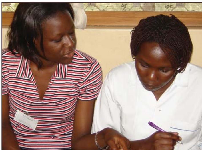
Participant à l'étude sur la fidélisation du personnel de santé