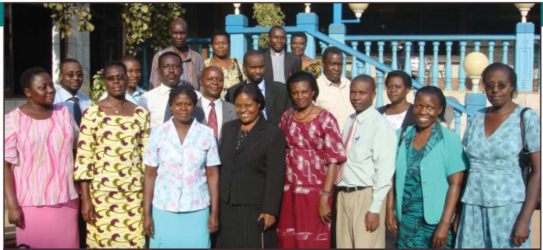
Le personnel du Ministère de la Santé durant un atelier de soutien de la performance

The Capacity Project IntraHealth International, Inc. 6340 Quadrangle Drive Suite 200 Chapel Hill, NC 27517 Tel. (919) 313-9100 Fax (919) 313-9108 info@capacityproject.org www.capacityproject.org