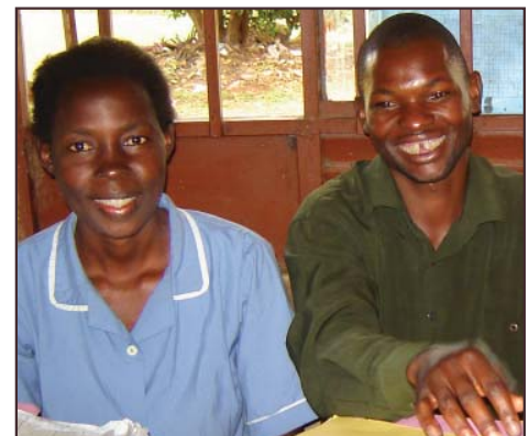
Participants à l'étude sur la fidélisation du personnel